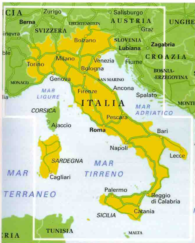
Autostrade: nel Sud scala a pioli con due autostrade sulle coste. «il Mezzogiorno senza spina dorsale non sta in piedi!» (N. Paone)

Sorgente del Volturno: energia per privati, senza ricaduta per il molise