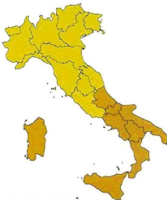
Mezzogiorno a "sistema"

Una considerazione sia poi consentita al Molise, che, regione montuosa per oltre il 50%, ha l'intero territorio assoggettato a vincoli con parchi, riserve naturali, Sic, e chi più ne ha più ne metta. Tutti vincoli che riducono enormemente i diritti degli abitanti, ai quali, peraltro, è stata sottratta dallo Stato l'unica forte risorsa naturale, l'acqua. Acqua che vuol dire sorgenti, falde, boschi, beni i cui custodi veri sono solo gli abitanti: abitanti che purtroppo devono emigrare ogni giorno di più lasciando il