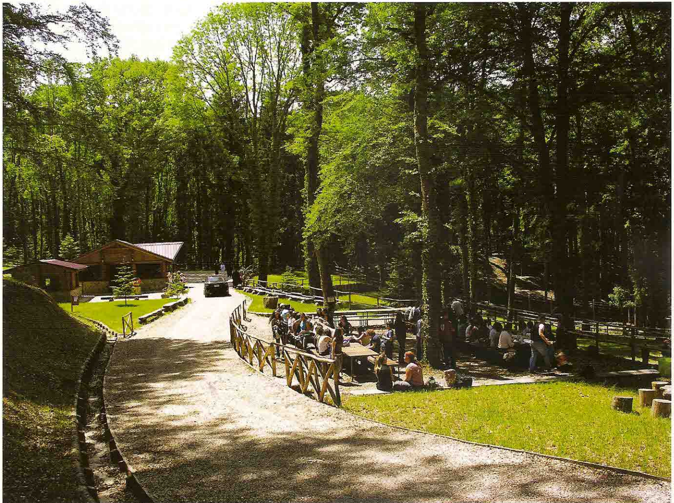
Vastogirardi (Is). Montedimezzo, Riserva Naturale Mab dell'Unesco.

«... le città del Sud sono meno collegate tra loro, non fanno rete e incontrano maggiori difficoltà di comunicazione.» (Il Sole 24 Ore, 27.11.2011).